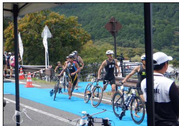
トライアスロン競技の様子