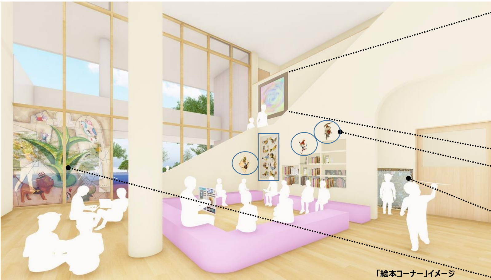
「絵本コーナー」イメージ

・絵本コーナーの大窓には、反転した「どうぶつえん」の絵を内側から楽しむことができ、スタンドグラスを通して床に映りだされた様々な色も同時に楽しむことができます。