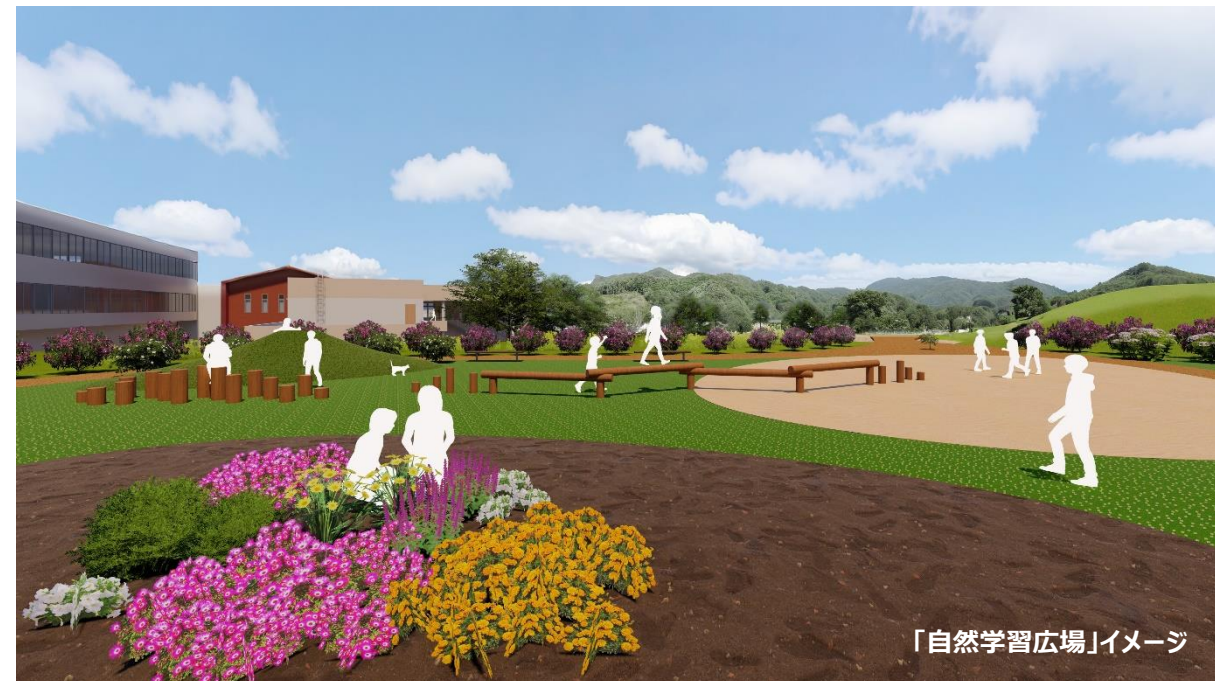
「自然学習広場」イメージ

・川岸小学校で大切にしてきた自然を最大限に活用して鳥の巣箱の設置や、木陰で休むことのできる広場にします。