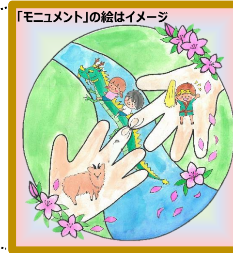
【統合4園を象徴するモニュメント】

・統合する保育園4園（川岸・成田・夏明・つるみね保育園）を象徴するモニュメントを階段上部の壁面に掲げます。 ・統合4園で大切にしてきた自然、つつじ、天竜川などの特色を新園開園後も大切にすることを培います。 ※保育士が描いたイラストをカラー印刷後、イラストの外側部分を園児が着色して仕上げます。