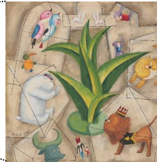
【「どうぶつえん」のステンドグラス】