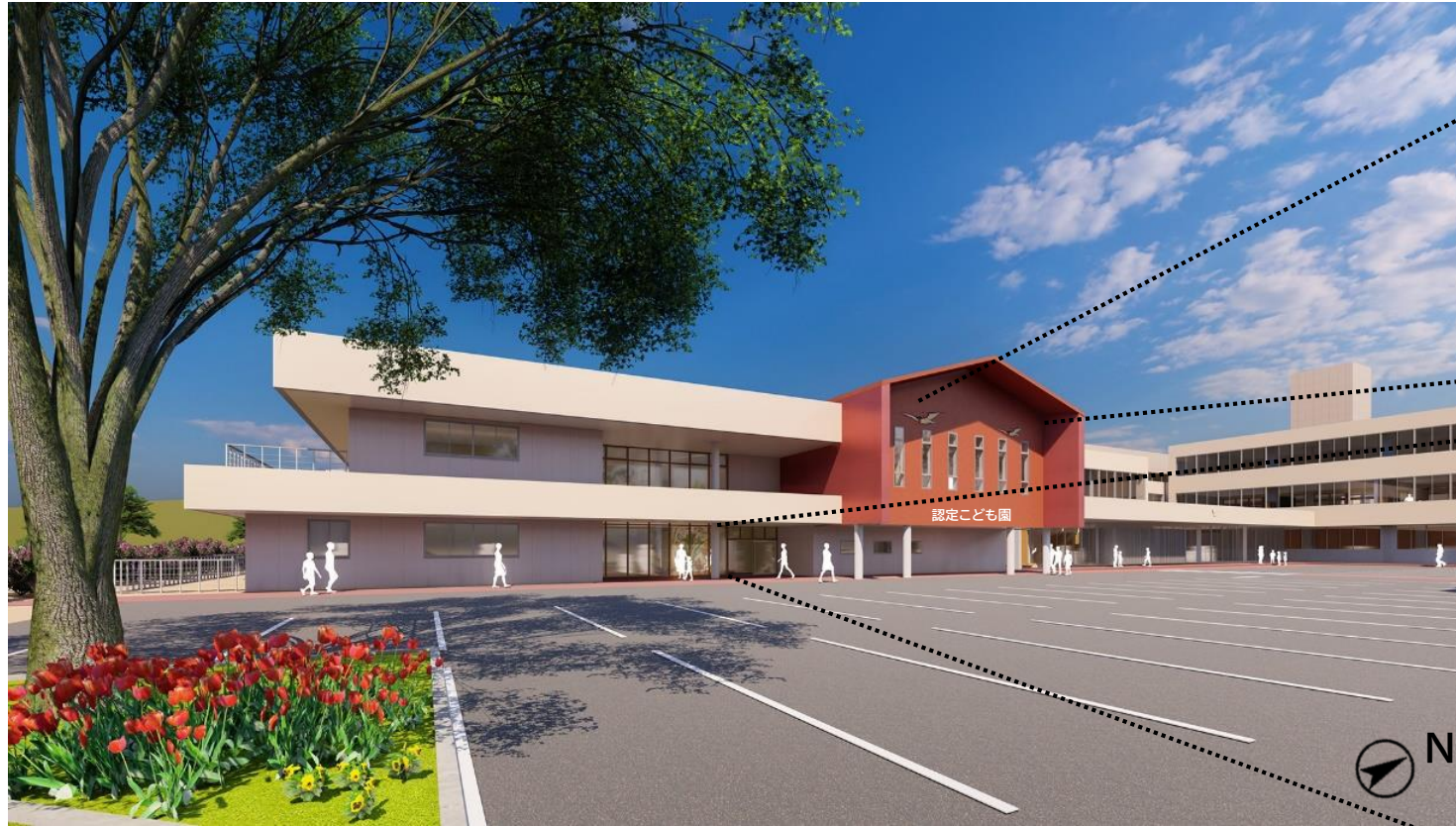
【正面から見た「認定こども園」外観イメージ】