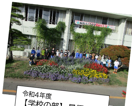
令和4年度 【学校の部】最優秀賞