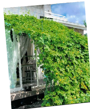
令和6年度 【一般の部】最優秀賞

岡谷市では、皆さんが工夫して育てた「緑のカーテン」の作品を募集しています。自慢の「緑のカーテン」を写真に収めて、ご応募ください。