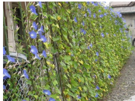
長さ 30mの朝顔のカーテン