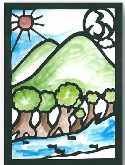
ふるさとの自然はみんなで守ろうよ