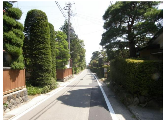
まちの中の美しい緑や昔からのまちなみのある景色