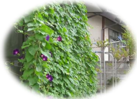
きれいな朝顔のカーテン