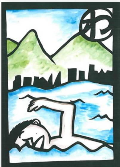
わーきれい 諏訪湖でみんな泳ごうよ