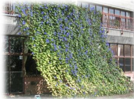
小学校の巨大カーテン