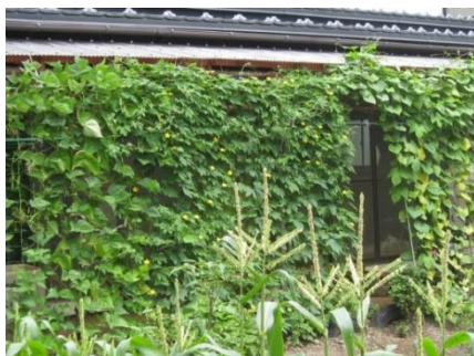
ゴーヤのカーテン