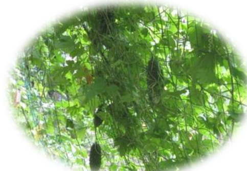
ゴーヤのカーテンを内側から