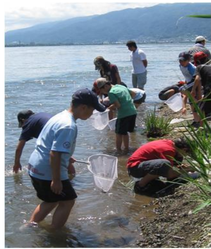
こどもエコクラブ 水生生物観察会