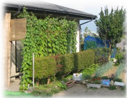
朝顔のカーテンで涼しそう！