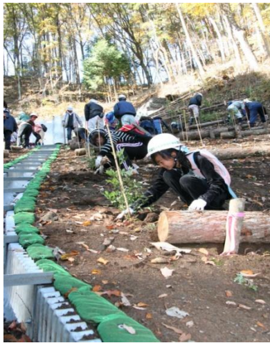
平成18年7月豪雨災害後の治山事業