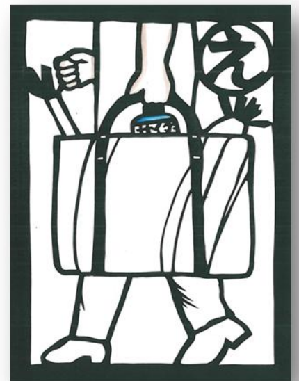
エコバッグいつもわすれずもってこう