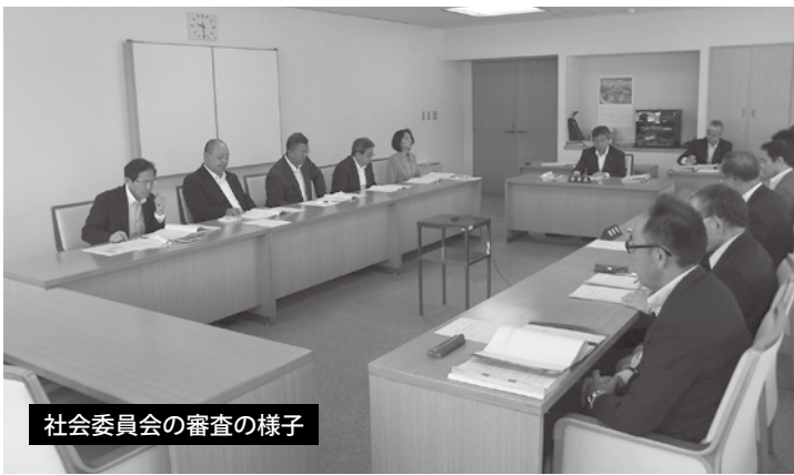
社会委員会の審査の様子