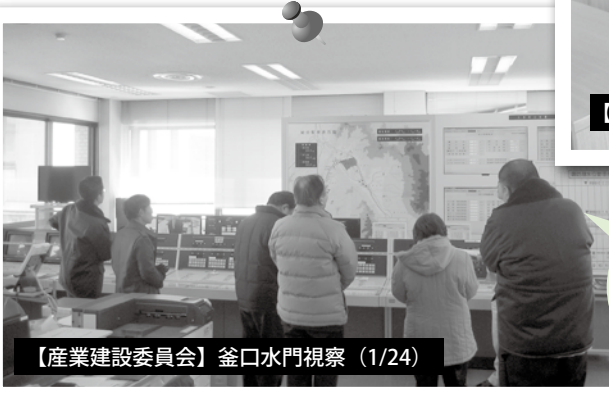
【産業建設委員会】釜口水門視察 (1/24)