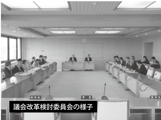
議会改革検討委員会の様子

今後、委員会を定期的に開催して検討項目及び優先順位を決め、目的達成のため、精力的に議会改革に努めていきます。