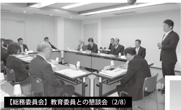
【総務委員会】教育委員との懇談会 (2/8)