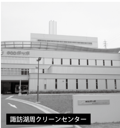
諏訪湖周クリーンセンター