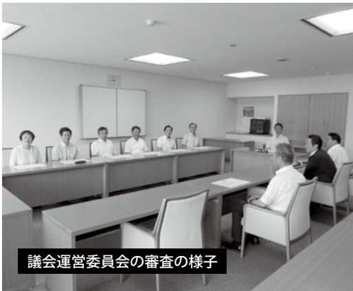
議会運営委員会の審査の様子