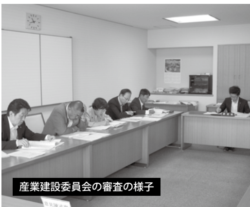
産業建設委員会の審査の様子