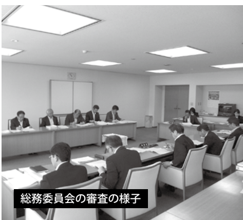
総務委員会の審査の様子