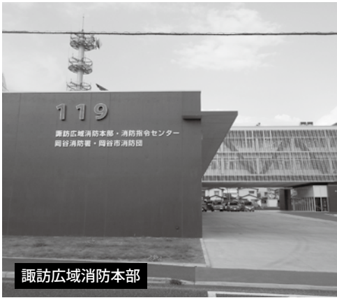
諏訪広域消防本部