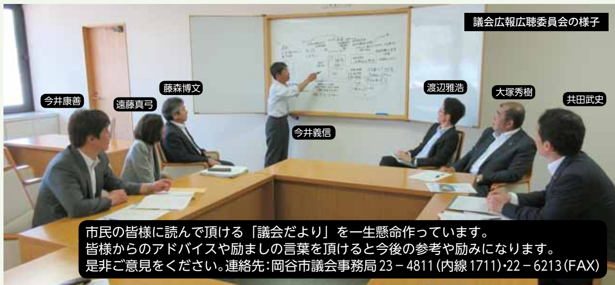
議会広報広聴委員会の様子