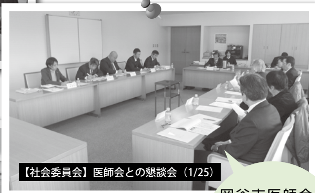
【社会委員会】医師会との懇談会 (1/25)