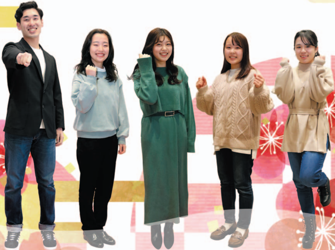
令和3年岡谷市成人式スタッフのみなさん