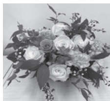
生花 アレンジ(初回)