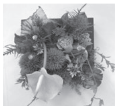
アート スタンド(2回目)