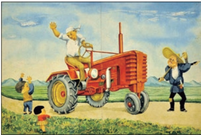
「くっどばい」1955年 武井武雄

開催日程は、広報おかや10月号、市のホームページ、各区の回覧板などで案内をしておりますので、多くの皆様の参加をお待ちしております。