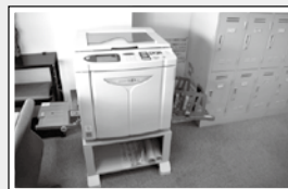
ボランティア団体・個人が利用できる印刷機