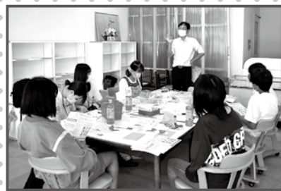
カードづくりの様子