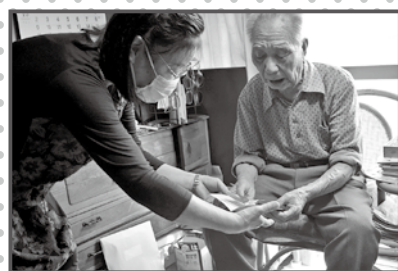
カードを手渡す様子