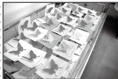
完成したメッセージカード