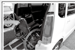
車いす移送車貸出