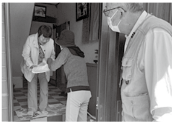
高齢者の見守り活動