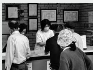
公共施設の受付を体験