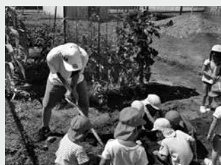
保育園でじゃがいも掘り のお手伝い

コロナウイルスの感染拡大を受けて2020年から3年間中止を余儀なくされていましたが、今年度は保育園、高齢者施設、障がい者福祉施設、公共施設など27の施設にご協力いただき、4年ぶりに開催することができました。3年の中止期間がありましたが例年に劣らない参加希望があり、全93名がボランティア体験に参加しました。