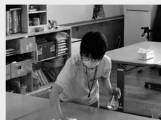
高齢者施設で消毒の お手伝い

ボランティアを受け入れていただいた施設の方からは「園児や利用者との活動だけでなく、そこに至るまでの準備や、活動後の片づけなど、見えにくい部分についても知ってもらう機会になった。」とのコメントもいただいております。それに応えるかのように参加者からは「ボランティアをして初めて、細かい仕事の多さや、楽しそうな活動の予想外の大変さを感じた。」「それでも、そういった大変さも園児や利用者の皆さんの役に立っているとわかるとやりがいを感じる。」といった声が聞かれました。