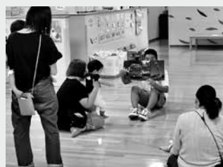
児童施設で紙芝居の 読み聞かせ