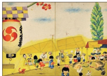
「たいこがひびく」1955年 武井武雄

「たいこがひびく」1955年 武井武雄 わかない市民参加型で多くの団体が登場するステージ「ふれあい広場」などが行われ、中心市街地は祭り一色となります。 市民の皆様をはじめ、お盆の帰省でふるさと岡谷に戻られた皆様、また、観光客の皆様もご家族そろって、4年ぶりとなる岡谷の夏の風物詩を楽しんでいただきたいと思います。