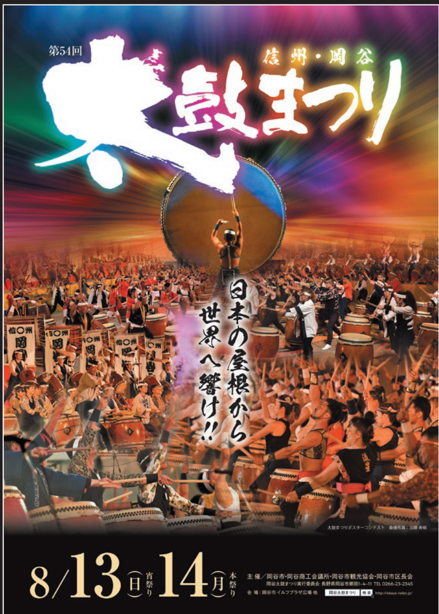
太鼓まつりポスターコンテスト 最優秀賞 加藤寿樹さんの作品