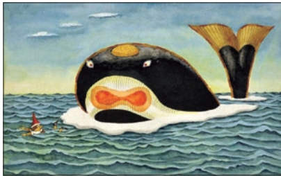
「ピノキオ」1968年 武井武雄

岡谷市にとって、忘れることのできない「平成18年7月豪雨災害」から17年、「令和3年8月大雨災害」から2年が経とうとしています。土砂災害を経験した本市は、災害の記憶を風化させることなく、災害の経験から得た教訓と知識を後世に伝えるため、様々な取り組みを行っています。先月7日から8日にかけての前線に伴う大雨の際には、川岸東の一部地域に土砂災害の恐れが高まったため、避難情報発令判断基準に基づき8日早朝4時30分に避難指示を発令しました。本号でも「防災・減災」の特集を組んでおりますが、これから迎える梅雨の時期や、そして夏から秋にかけての季節は、前線や台風の影響による大雨に警戒が必要になります。