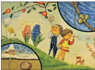
「くさもきも」1960年 武井武雄