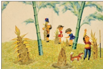
「たけのこのびたぼくらものびた」 1957年 武井武雄

の作品や世界観などを建物の外観全体を使用して表現するとともに、生家の敷地内にあり、また長屋門を建物の玄関に再現するなど、色々な工夫が取り入れられていますので、近くにお越しの際はぜひお立ち寄りください。今後、岡谷市の誇りである武井武雄先生の童画文化発信に、全力で取り組んでまいります。