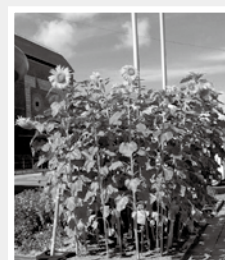
諏訪湖ハイツ正面玄関前