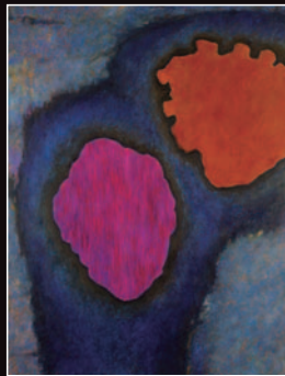
辰野登恵子 Untitled 97-6

日本の現代美術を牽引し、国内外に活躍の場を広げた岡谷市出身の画家、辰野登恵子先生が、昨年9月に逝去されました。今回の展示では、日本の現代美術史に揺るぎない評価を固めた画業の足跡を資料や作品を通して紹介します。