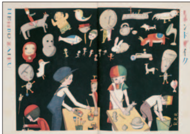
「ネンドザイク」 コドモノクニ 1927年2月号 武井武雄