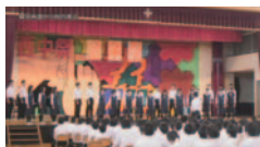
岡谷西部中学校音楽会