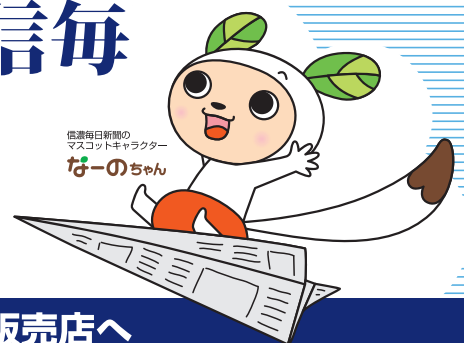
信濃毎日新聞の マスコットキャラクター はーのちゃん