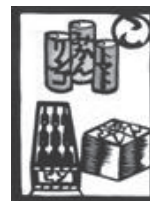
ごみ整理 ちゃんと分別 リサイクル