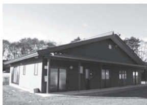
【樋沢地区】樋沢区公会所

また「地域活動助成事業」を活用し、公益財団法人長野県市町村振興協会より宝くじの助成を受けて、新倉区で折りたたみテーブルなどを、横川区でAEDなどを、岡谷市(危機管理室)でテントを、岡谷市(子ども課)で無線機などを整備しました。