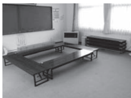
【新倉区】折りたたみテーブルなど