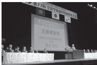
全国大会での表彰(熊本市)

30年に及ぶ生徒さんたちとの歯科保健活動が全国という荣誉で評価され大変うれしく思います。今後も校内にとどまらず、家庭や岡谷市を含めた地域に、歯科保健の場を広げていってほしいと願っています。