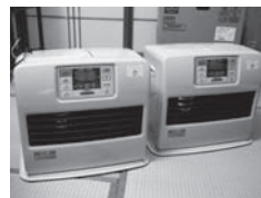
【西堀区】暖房機など