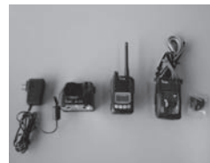
【岡谷市(子ども課)】無線機など