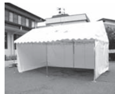
【岡谷市(危機管理室)】テント