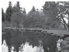
自然とのふれあい(公園)