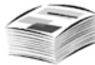
いきいきサロン事業