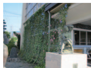
平成24年度応募作品