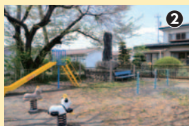
2 児童公園の隅に遠慮がちに建つ小萩神社跡地の碑