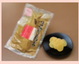
じゃらん賞「上野大根ぬか漬」