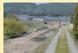
堤防の道は ゴキゲンな散歩道