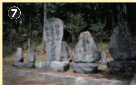
歴史ある横川の延命講(江戸時代の山岳信仰)。鉢伏山登山は現在も続けられている

ど、湿気のある晴れた日には、光るコケがよく見えるらしい。小山になった丘を注意深く下ると、