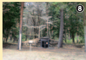
どんな人が眠っていたのか…唐櫃石古墳

公園の裏から、やおら山の斜面を登り、山の神を経て、上の原小の背面を抜ける。各地に富士見丘の地名あれど、諏訪湖とのこのバランスは秀逸で、延命講の碑も景色を眺めているよう。右手にヒカリゴケでも有名になった唐櫃石古墳がある。この日は、かすかに判別できる程度だったが、雨上がり雨上り雨の翌日な