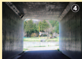
4 国道バイパスとの立体交差。向こう側に鳥居がフレームイン

す出早に合祀、現在の出早雄小萩神社となった。そうした経緯を踏まえ、静かな住宅地を進むと、そこは中山道。辻の道祖神、家々の花や樹が、ふわりとやさしさを醸し出している。橋で右折し川べりを行けば、景色も広がって、さらにのどか。解放感に浸って、安心して歩けるのがいい。この日は、車と出会うことがなかった。