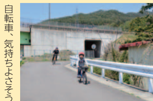
自転車、気持ちよそで