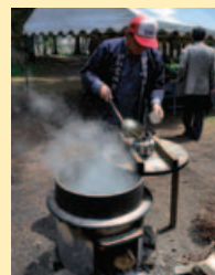
「長命水」で入れたお茶のおいしいこと。この名水を毎日くみに行き、たっぷり湯を沸かす

公園の裏から、やおら山の斜面を登り、山の神を経て、上の原小の背面を抜ける。各地に富士見丘の地名あれど、諏訪湖とのこのバランスは秀逸で、延命講の碑も景色を眺めているよう。右手にヒカリゴケでも有名になった唐櫃石古墳がある。この日は、かすかに判別できる程度だったが、雨上がり雨上り雨の翌日な