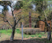
塩嶺王城県立公園の一部で長野県自然100選の公園は、広さ4000坪。カエデは15~6種類、植物群は240種ほど。夏にかけて、さまざまな花が咲き競う