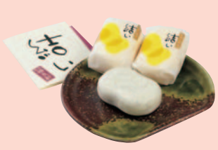
準グランプリ「結い」