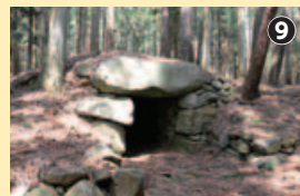
姥懐古墳は山のなかにひっそりと

グリーンバレーファームの花ハウス。カーネーションやハイドラランジャヤーが育てられている。さらに坂を少し上り山に分け入って、姥懐古墳へ。こちらは、飛鳥の石舞台のような石室の天井岩が印象的。ウグイスのさえずりがすがしさをくれた。