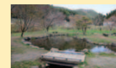
社叢の奥は親水公園