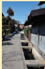
横河川から引かれていたせぎ「南の用水」