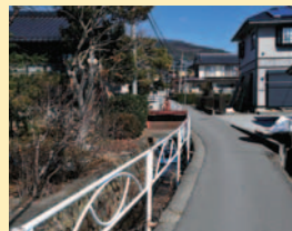
五兵衛せぎに沿って…