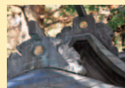
拝殿屋根の菊の紋章

向かうは旧渡辺家。4月下旬から5月上旬にかけては、五月人形も飾られるらしいので、ぜひ立ち寄ってみたい。南用水せぎの流れに沿って下ると、