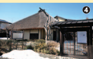
3大臣の生家、旧渡辺家

向かうは旧渡辺家。4月下旬から5月上旬にかけては、五月人形も飾られるらしいので、ぜひ立ち寄ってみたい。南用水せぎの流れに沿って下ると、