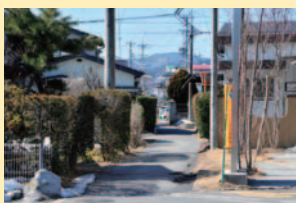
初期中山道にあたる路地 街道のイメージをかき立てる柿の老木、この風情!

昔は、森が今の3倍ほどもあり、その南に初期中山道が通っていて、古屋敷といわれた村の中心は諏訪湖との間にあったとか。南の鳥居をくぐって外へ。参道が延び、大きな鳥居があつた往時に思いをはせれば、風格のある柿の木が、初期中山道を懐かしむようにたたずんでいた。