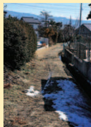
こちらも初期中山道のなごりの小道