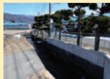
南用水と北用水が合流