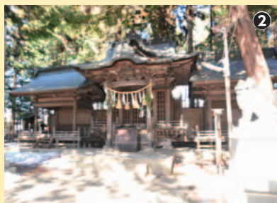
区民の産土神(うぶすながみ)正八幡宮(拝殿)