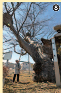
まさに神の化身。貫禄がありすぎて言葉が失ってしまう

由来だろうが、樹齢1000年以上、すべてを受け止めてくれそうな巨幹は、屋久杉にも劣らない大迫力で何とも神々しい。新興住宅地を抜けて、最後は「御所清水」へ。清水が湧いていた場所は、現在、沖電線の敷地内のため、表の門の外に、宗良親王が朝夕使用した清水と記録する碑が建てられている。昔は、横河川の扇状地のこの辺りに、伏流水が湧く泉はいくつもあったらしい。南北の用水がここで合流しているのも水つながりでふしぎと思いつつ、清々しい気分が帰りにつく。