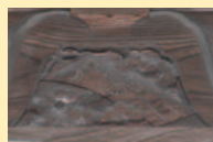
本殿側面には「錦(にしき)の御旗(みはた)」の彫刻。中心には菊が…