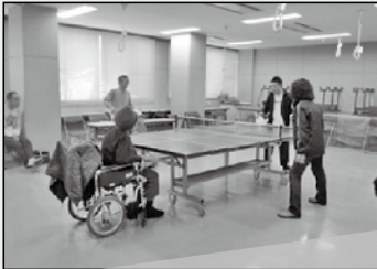
スポーツ サウンドテーブルテニス、スルーネットピンポンを楽しみました。

12月13日（木）諏訪湖ハイツにおいて、市内の障害者が一堂に会し、自分の興味のある講座に参加し交流を深めました。