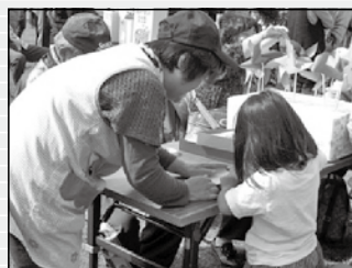
昔懐かしさがぐるま。小さな子も大人の手を借りながら一生懸命作りました。