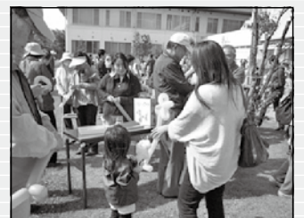
大人気だったバルーンアート。犬やお花、剣などを作りました。