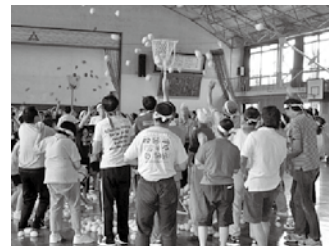
福祉大運動会 9月1日（土）