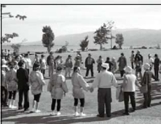
みんなで交流しながら輪になり、ゲームや体操をしました。