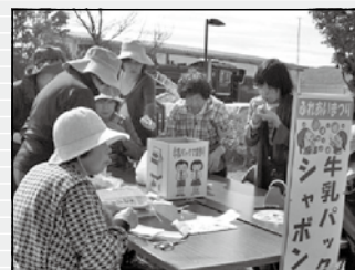
牛乳パックを使った簡単笛作り！大人も子供も楽しみました。