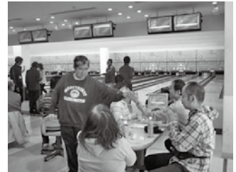
ボウリング大会 12月9日（日）