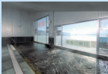
景色のすばらしい大浴場