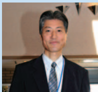
「橋ができ、湖周の魅力がアップしました」と諏訪湖ハイツ中島館長