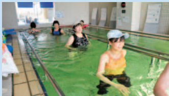
温泉の歩行プールで足腰の強化。ひざが痛いなどの悩みがなくても、健康のためにと通う人も。予約により健康運動指導士による個別指導が受けられる