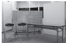
【市商業観光課】パネルなど