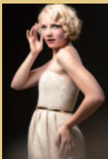
デニーズ・ベック(ソプラノ)