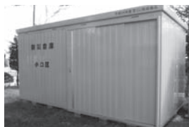
【小口区】防災倉庫など