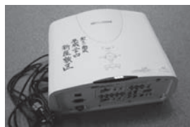
【新屋敷区】プロジェクターなど

財団法人自治総合センターより宝くじの助成を受け、市商業観光課でパネルなどを整備しました。また、公益財団法人長野県市町村振興協会より宝くじの助成を受け、新屋敷区でプロジェクトなどを、小口区で防災倉庫などを、市健康推進課で血圧計を整備しました。今後も、さらに地域コミュニティ活動の向上に努めていきます。