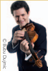
アントン・ソロコフ (指揮・ヴァイオリン)