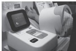
【市健康推進課】血圧計