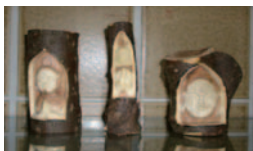
ロビーに見本作品展示中

申込み…1月9日(水) 午前9時～18日(金) 午後5時(土・日・祝日は除く)、公民館窓口または電話で受付(初日は窓口のみ)。