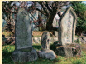
左から尹良(ゆきよし) 親王(後醍醐天皇の孫)を祀る尹良神社碑、毘沙門天立像碑、徳本念仏碑