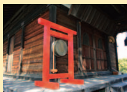
薬師堂と市の文化財指定を受けている鉦鼓(江戸中期の作)

の参道入口には、南無阿弥陀仏の碑。念仏徳本による個人的な文字は、どこかアートのようだ。階段を登りきれば小山にお堂が建つ。堂内からは、念仏に合わせたたくという青銅製の鉦鼓が。朱塗りの杵がまぶしいものの、雅楽のものと比べると、