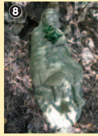
役行者さま、柿を手に休憩中!