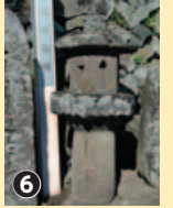
沢の辻の最古の石幢

質実剛健な印象。 上の辻、沢の辻にも、たくさんの石造物が集められている。馬ではなく牛!…牛頭観音、市内最古の石造物である石幢など、めずらしいものがあつて楽しい。