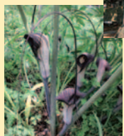
自生するウラシマソウ。5月に開花