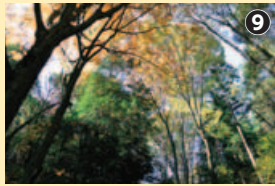
蛇の洞口。秋の森にぼっかりと静かな空間…

塾を開いた小野道益と、その養子で蘭学などの学問を究めた小野道晏の墓が、両者を敬う門弟によって建てられている。 山すそを縁取るように歩いて「観音堂」の裏手に到着。ここに安置されている観音像のご開帳