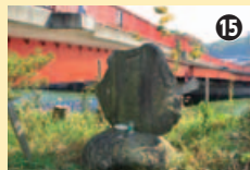
観蜚橋のたもと。水神さまの碑が道しるべを兼ねている(左いい田道 右むら道)