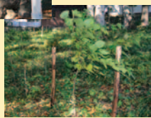
ケンボナシ若木。落ちた実から発芽したのか、自然のたくましさで拍手

かつての川岸村役場は、J A川岸店とワタナベ商店の並ぶ場所に。昭和8年完成の2代目村役場(旧川岸支所)は、現岡谷消防署のような瀟洒な建物だったという。「新倉十五社」はそのすぐ裏手。「いるふの扉2」で、ケンボナシを紹介したが、その後3本が枯れ、心配されていた。ところが、社叢