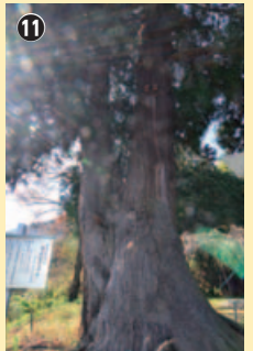
神の化身とカンゲキの再会