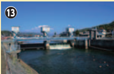
天竜川に添って…西天竜ダム

幕末に沢の学校の塾長を務め、明治の学校設立にも尽力した堀川泰徳の徳をたたえる筆塚を経由し、観蜚橋に出て終了。(取材/11月6日)