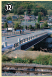
新しくなった天白橋

は、なんと61年ごと。一生のうちで、一度拝めるかどうかなので、代わりに(失礼!)青面金剛像にあいさつ。 前回、杉の巨木と出会った「毘沙門堂」は、この少し先。見覚えのある道祖神の上段に、貫禄ある杉がどっしり構えている。向拝に法輪を刻むお堂の本尊、毘沙門天とは別に、境内右手の石造物群にも毘沙門天