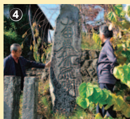
昔の人はこの碑を「とこんさま」と呼んだ。市内にある10基のうち4基が新倉に。なかでもこれは最大