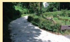
公園の道は区民が舗装整備