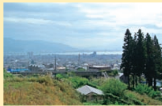
景色がすばらしい

山を「ひとぼし」と呼ぶ人がいるの 望、晴れていけば、富士山もきれいだろう。八倉沢と常規寺沢の間の