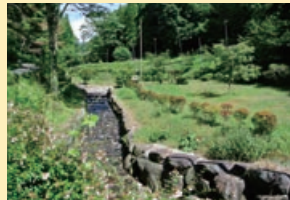
ひとぼしみちの 木立のトンネル