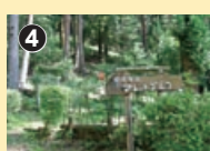
手作り看板がかわいい