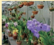
たくさんのランが...