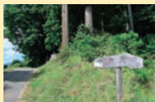
散策のテンションが上がる

は、信玄ののろし台があったからだと伝えられているが、なるほど！合点がいく遠望だ。「ひとぼしみち」を通して、区民が「さつきまつり」を楽しむ常規寺沢公園へ。右手にマレットゴルフ場、左手には、広々とした墓地がある。風が避けられそうな日当りのよい場所、ご先祖も高枕か。同じく日差しを浴びてほつりの山の神、川の番