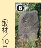
左塩尻道の道しるべ (取材/10月1日)