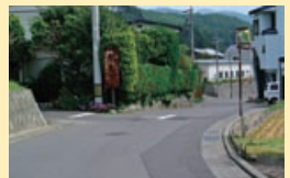
下ってすぐ、お宿の看板を左折

「八倉沢」へ。国道142号・20号バイパスのトンネル工事に伴う区画整理により、一帯には新しい住宅も増え、公園も整備された。コロビ石という大きな岩が、園内に横たわる。岩盤の山なので、こうした大きな石が出るらしい。諏訪湖を一望、晴れていけば、富士山もきれいだろう。八倉沢と常規寺沢の間の