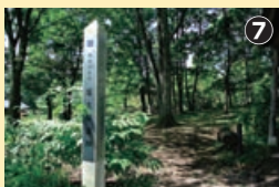
梨久保式といわれる特徴的な土器や、鉄平石を床に敷いた住居跡が発掘された

坂を下ると、交差点の向かいに古い道しるべを発見。いにしえの旅人に思いをはせ、火の見やぐらを仰げば、秋の空が美しい。 ランを育てていると案内してくださった。 ランを育てていると案内してくださった。