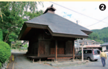
平成9年に銅板葺きとなった中村薬師堂