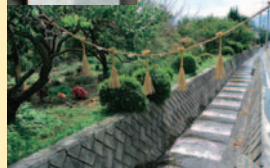
風まつりのしめ縄