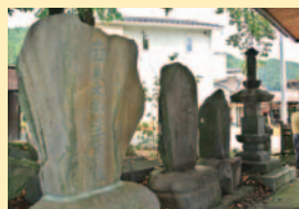
お堂のまわりには石碑、石像物、神さまが集結