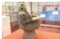
飛び出せ! テレビ美術考古館