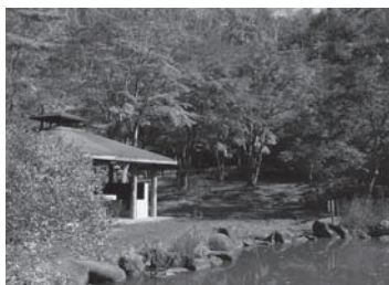
自然の美しさと潤い