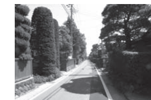
昔からのまちなみ