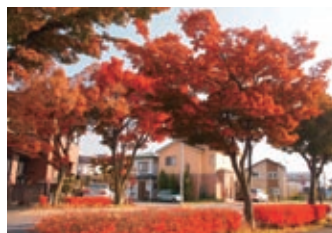
H23年度応募作品 「赤く染まる東堀新道」