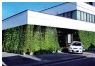
H23年度応募作品 「節電対策」

問合せ●都市計画課(内線1372・1373) Eメール toshikei@city.okaya.lg.jp