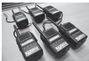
【小尾口区】 トランシーバーなど

公益財団法人長野県市町村振興協会より宝くじの助成を受けて、間下区で展示用パネルなどを、小尾口区でトランシーバーなどを整備しました。それぞれの区では、さらなる地域コミュニケーション活動の向上に努めます。