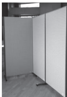
【間下区】 展示用パネルなど