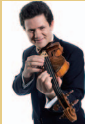
アントン・ソロコフ (指揮・ヴァイオリン)

1965年、ウィーン交響楽団の首席メンバーによって結成された伝統のアンサンブルが、当時の演奏スタイルで、シュトラウスの世界を楽しませいっぴいの舞台に再現。新春を飾る華麗なウィンナ・ワルツの数々をお楽しみください。