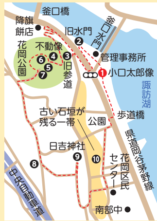
徒歩所要時間...約50分