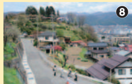
里山の風情を楽しみながら分岐

鎌倉街道に折り返し、二股を下り閑静なたたずまいの日吉神社へ。顔が半分風化した「しろうづか婆さん」は、いわれも含めてとても印象深い。細い坂の道は、一帯が古くか