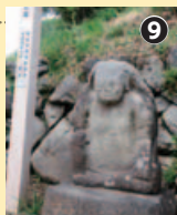
しろうづか婆さん石像。三途の川の脱衣姿がなぜここに?

石垣が示すのは湖との境界。ここは奥まで入り江になっていた場所?... などと思いをめぐらしながら、湖畔公園にもどる。