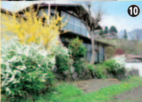
諏訪湖の昔の姿を想像しながら