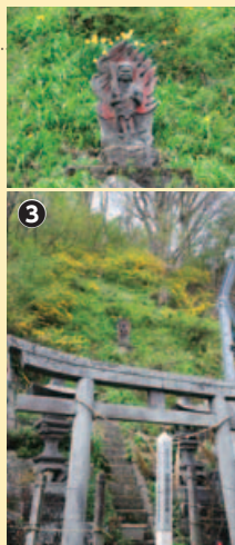
鳥居上のお不動さま

水門で迎えてくれたのは小口久一区长。銅像の主は、郷土のヒーロー小口太郎さんである。三校(現京大)ボート部在籍中、練習に通った琵琶湖で、故郷に思いをはせ作詩したのが「琵琶湖就航の歌」。小口太郎顕彰碑等保存会の小口瀧明会長に「長野滋賀県人会の人たちも、ここに来ると琵琶湖を思い出すそうですよ」と聞いて納得だ。