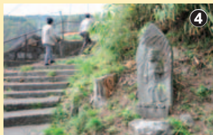
石段上部のお不動さま。険しい顔でも、このサイズだとかわいらしい