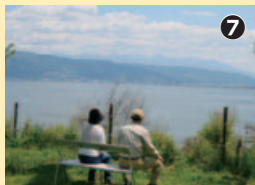
辰野から来たというご夫婦も景色にくぎ付け

ここが山岳信仰の聖地だったことを示すもので、往時をしのぶ子ども相撲や火渡りなどが、毎年秋に繰り広げられる。