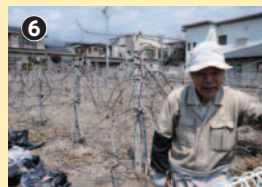
住宅地のなかのリング畑