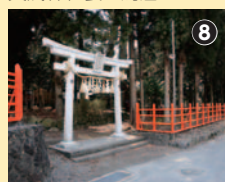
賀茂神社裏の鳥居