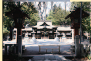
賀茂神社境内も散策は楽しい