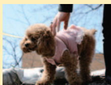
川沿いをお散歩中のトイプードルちゃん

ズンを迎え、掲示板には大会予定がいくつもはり出されていた。注意して国道を渡れば秋葉神社。例祭のこの日、境内にはぞ