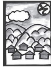
そらたかく 青く広がる ふるさとの空