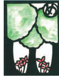
めざせ 緑の多い 岡谷市に