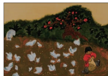
かなざわ めぐみ「とり」より

イルフ童画館は、児童文化の創造を担う作家を発掘するため、全国より絵本作品を募集し日本童画大賞を開催しています(2年に1度)。今回は、昨年の第6回童画大賞で上位入賞した3組のみなさんの、個性あふれる作品を紹介します。