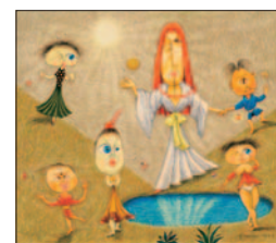
武井武雄 「神様とお化け」 1973年

そのほか、2月に発売された『武井武雄のこけし』(パイ インターナショナル刊)を記念して、武井武雄の描いたこけしを展示します。