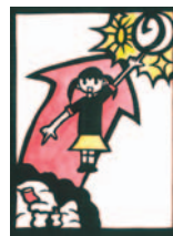
リサイクル どんどん進め ごみゼロ岡谷