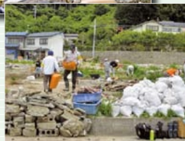
被災されたお宅の瓦礫や泥の撤去、使えなくなった家具家電の運び出しが主な活動内容でした。(大槌町)