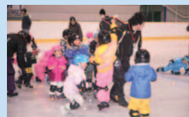
屋外リンクのオープンを前に「親子で楽しむファミリースケート教室」があったこの日、アリーナは大盛況。楽しく遊んだり滑ったりするゲームなどが行われた

水に乗るときは細心の注意を。とはいえ、滑る感覚をまったく怖がるようすもなく、即座にカンを取り戻していく子どもたちは、楽しくて仕方がないオーラを全身から出して夢中に。親子で手をつなぎ、友だちといっしょに滑れば、みんなが笑顔。いすソリも、とっても気持ちよさそう。あつという間に、1時間半ほどが経過し、気がつけば、それぞれが見違えるほどの上達ぶり。さすがは、おかやっこ。取材協力、どうもありがとう！