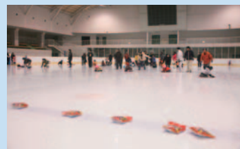
氷質がすごくいいと評判のアイスアリーナは、フィギュア、ホッケー、ショートトラックの公式試合ができる国際リンク