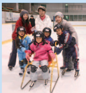
最後に、みんなで記念写真。おつかれさまでした。スケート、いっぱい楽しんでね！

手をつないだり、親密感がアップするのだろう。家族にも、デートにもオススメだ。季節を楽しむアクティビティって、実は結構、贅沢。それが手軽にできるのだから恵まれているのかも。レジャーに、スポーツに、自分のペースで楽しめて健康にもいいし。想像していたら、ムズムズ、滑りたくなってきたような…。さて、やまびこデビューに、いざ！屋外リンクは、2月中旬までのシーズン限定。初めての人も、今年もというあなたも、冬とがつつり向き合うスケート、楽しんでみて。