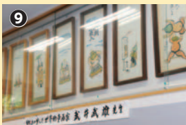
公会所の講堂には、ユーモラスに野菜の力士を描いた武井武雄の灯籠絵が飾られている

雄は、郷土の子どもたちを兄弟と慈しみ、天神さまのお祭りには、毎年、愉快的灯籠絵を奉納。西堀保育園の敷地も、子らのために寄付したという。武家屋敷の格式を示す武井家の長屋門をあとに、釣り堀などを見ながら帰路につく。