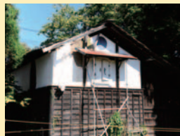
横河川のベンチ横にある「おしからまんじゅう」の絵に描かれている蔵