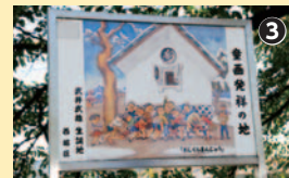
ベンチと童画にほっと一息

橋を渡り、堤防の道を進む。市のウォーキングイベント「あるき太郎 花回廊」でもおなじみのこのコースは、区民の草刈りによって整備された河原、さらさらと流れる水もすがすがしい。途中に3か所設けられたベンチの横には、武井武雄の生誕地をアピールする童画のボードもあり、桜の古木が緑のアーチをつくる夏や秋も十分に美しく、散歩気分を盛り上げてくれる。 田中線を横断し、そのまま先へ。すると向かい