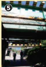
線路のトンネルを抜けて

側の土手下に、レトロ感あふれるユニークな鉄塔を発見。電車から見たことのある「岡谷市信州味噌…」の広告塔だ。いつ建てられたものか、置き去りにされたロボットのような風情に、ふしぎと心が引かれる。次の橋を渡り、今度は西岸を歩く。線路をくぐって、堤防沿いをさらに北上。堤防の桜約450本のうち、西堀には250本ありが植えられているというが、川の両岸に並木のあること、また車が通らない小道を歩くことができるのも、その価値を高めていると思う。