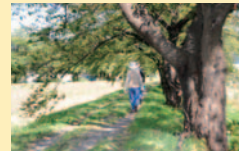
ウォーキングを楽しむ人の姿も…