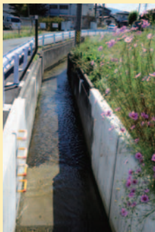
コスモスが彩る五兵衛せぎ