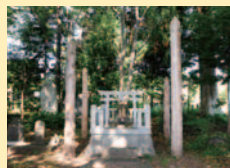
南宮神社とその御柱