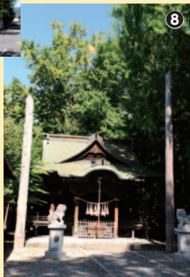
祭神は、菅田別命(ほむたわけのみこと)、息長帯姫命(おきながたらしひめのみこと)、武内宿禰命(たけうちのみこと)