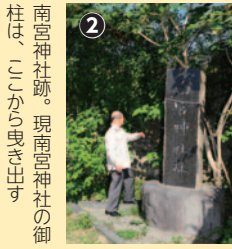
② 南宮神社跡。現南宮神社の御柱は、ここから曳き出す