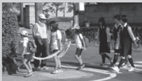
登校時の見守り活動

期間中は、みなで活動に参加し、地域などで子どもたちの見守りの輪を広げていきたいと思います。