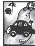
ポイ捨ては 町がはごれる やめようね

できるだけ汚さないよう、ルールを守って、公害のない安全なまちをつくりましょう。安全な生活環境を保つのは、わたしたち自身です。