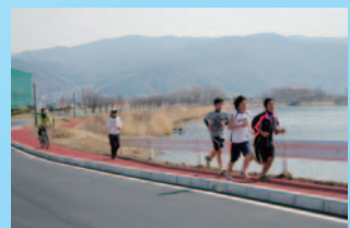
①ジョギングロード整備工事