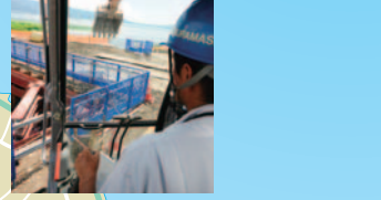
②11号線(今井通り線)舗装維持工事