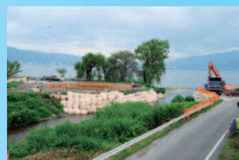
⑧横河川河口橋設置工事