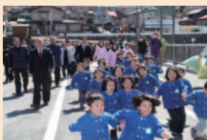
開通式の様子 うれしそうに駆け出す園児たち