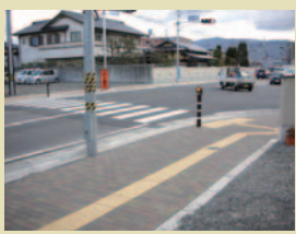
⑥12号線(小井川東町線)改良工事