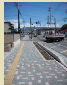
⑪岡谷川岸線拡幅工事