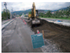
東堀線 整備中 側溝の整備も大事な役割