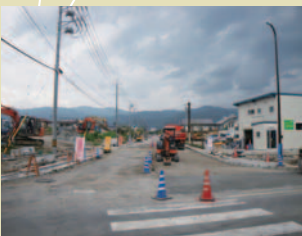
⑦湊横断歩道橋設置工事