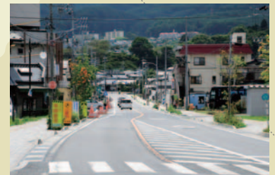
⑪岡谷川岸線拡幅工事

※総事業費とは、工事費、用地費、補償費、委託料などを含んだ金額であり、完了していないものは見込みの金額です。