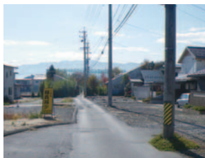
東堀線 整備前 急に狭くなり 路面も傷んでいた

歩行者も自転車も車も快適に通行できる、安心の交通環境と文化度の高い都市環境の両立と充実をめざして、市は現在、道路の拡幅と歩道確保をはじめ、通学路の安全対策、老朽橋かけ替え、交差点改良やバイパス整備による渋滞対策、既存道路のバリアフリー化などを推進しています。