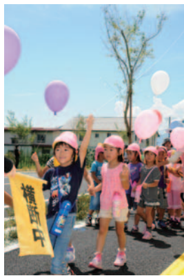
東堀線 開通式でのひとこま