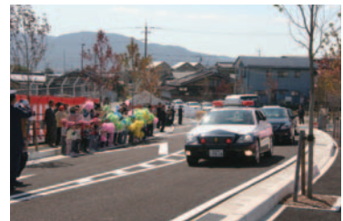
東町線開通式(平成21年10月13日)

また、安全性、景観に優れた、四季折々の自然に親しみながら健康増進が図れる、市民待望のジョギングロードも