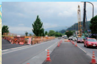
④12号線(小井川東町線)改良工事