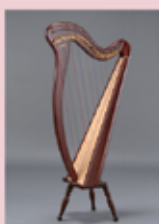
アイリッシュハープ

一般的なグランドハープだけでなく、珍しいサウルハープ、アイリッシュハープで奏でる癒しのサウンドをお楽しみください。ハープの魅力満載でお贈りします。