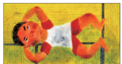
伊藤秀男「けんかのきもち」 2001年 ポプラ社

ダイナミックな筆のタッチと、繊細な描写が絵本をめくるたびにわかるがわる出てくる、伊藤秀男さんの作品。まるで画面から登場人物たちの声や、自然のざわめきが聞こえてくるようです。