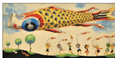
武井武雄「こいのぼり」 キンダーブック 1957年 5月号