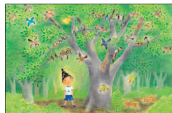
たばたせいいち「ひ・み・つ」 2004年 童心社

1974年に発売されて以来、多くの子どもたちの支持を受け、現在まで読み継がれてきた名作『おしいれのぼうけん』と、おばあちゃんのみみつのために奮闘する男の子を描いた『ひ・み・つ』の絵本原画を展示します。